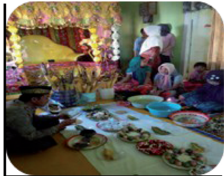
Picture 1. Female circumcision ritual in Gorontalo, Sulawesi

In the wider context, Muhammadiyah, the second largest Islamic organization, released a fatwa (legal edict) in 2010 that female circumcision is not advised. Mean-